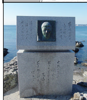
石原裕次郎記念碑