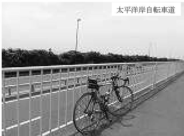
太平洋岸自転車道