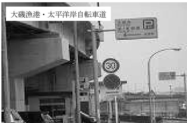
大磯漁港・太平洋岸自転車道